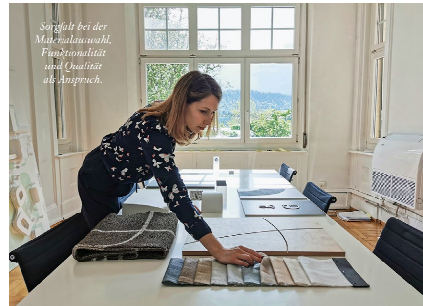
Sorgfalt bei der Materialauswahl, Funktionalität und Qualität als Anspruch.

Interview: Sigrid Hanke, Fotos: Ramseier & Associates Ltd.