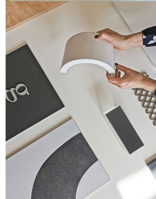
Entwürfe werden anhand von Modellen und Prototypen überprüft.